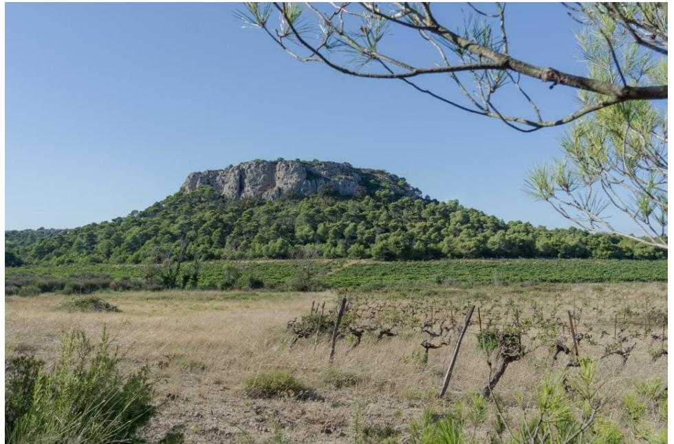
Pech Redon, butte-témoin dans le massif de la Clape – Aude