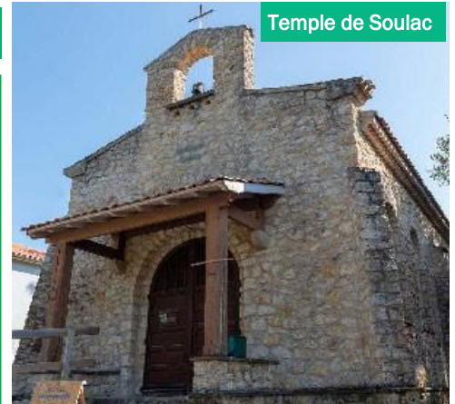
Temple de Soulac

Les cultes de juillet et août auront lieu à 10.30